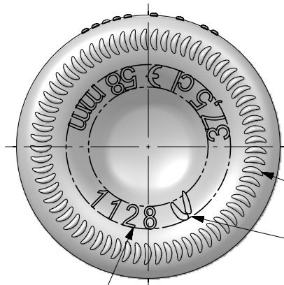
N° MODELO (JOB No) VISTA DEL FONDO (BOTTOM VIEW)

ESTRIADO UÑAS (STIPPLING) ANAGRAMA (PUNTMARK VIDRALA)