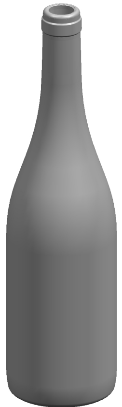
VISTA DEL FONDO